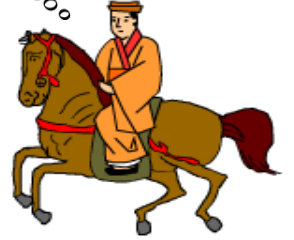
玉城朝薫 (1684～1734) 組踊の創始者

組踊は2010年にユネスコ無形文化遺産リストに登録された世界に誇る沖縄の伝統芸能です。