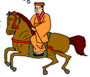
玉城朝薫 (1684～1734) 組踊の創始者

組踊は1972年、沖縄が本土に復帰すると同時に能、歌舞伎、文楽などと同じく国指定の重要無形文化財に指定されました。